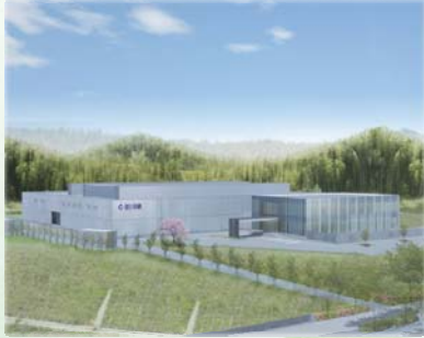
京都クリエイティブパーク